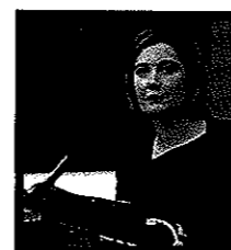
Frédérique Dalle, Magistrat

Ce livre rassemble les principales dispositions juridiques appliquées aux activités transformées par le numérique mais aussi les bonnes pratiques . Il permet une consultation facile, accessible, et tend à rapprocher le simple utilisateur, le consommateur, des droits qui existent dans ce cyberspace, voire de révéler des dispositifs innovants et encore non stabilisés.